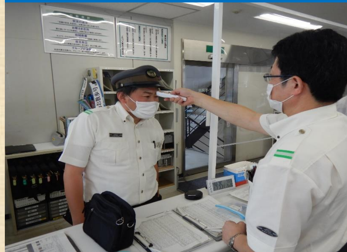
乗務員の体温を測定し、体調管理をしています