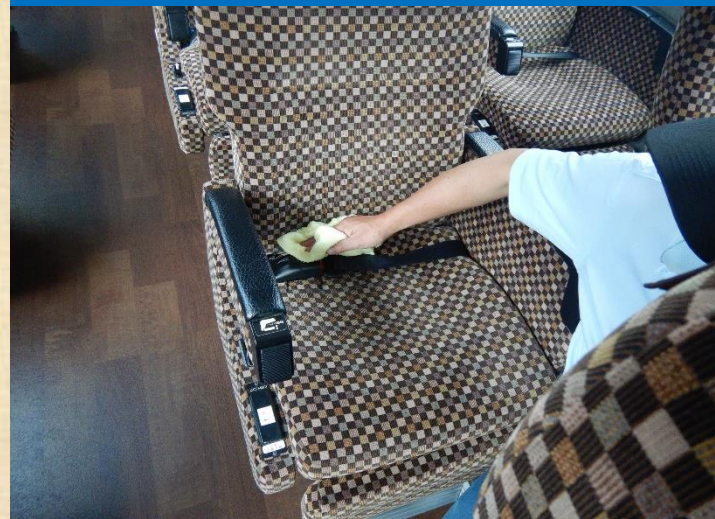
各座席ごとに消毒を実施しています