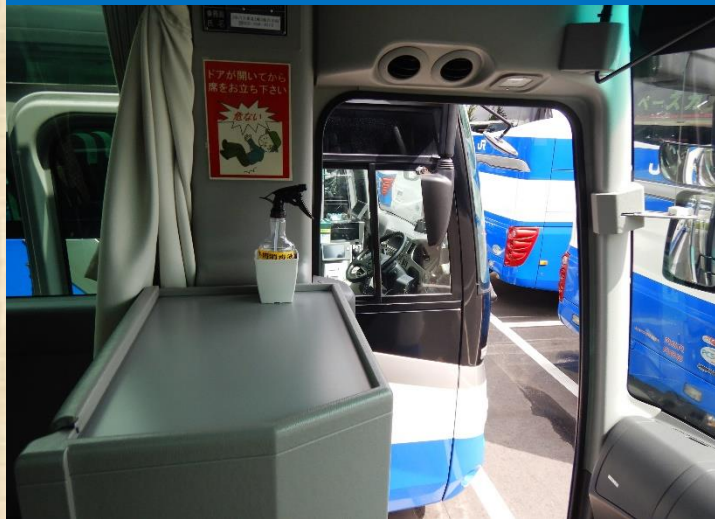
乗車時に手指の消毒をお願いしています