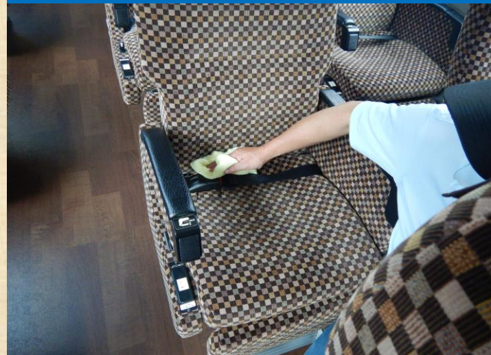
各座席ごとに消毒を実施しています