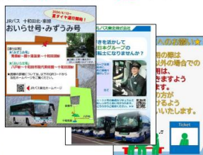
様々な広告を放映可能です！