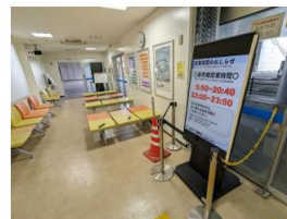
バスの利用者へ効果的にPRが可能