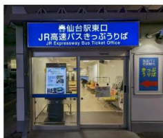
ご通行の方の目に入る立地！