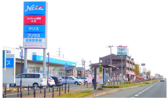
「ゆいとぴあ中央(上り)」仙台方面