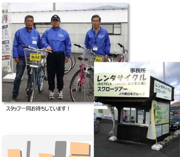
スタッフ一同お待ちしております！

◎地元在住のスタッフが、手作りMAPで平泉の名所・旧跡・お食事処・温泉等を親切・丁寧にご案内します。気軽に話しかけてください。きっといい思い出になりますよ。