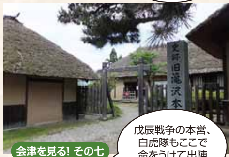
会津を見る! その七