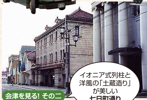
会津を見る! その二