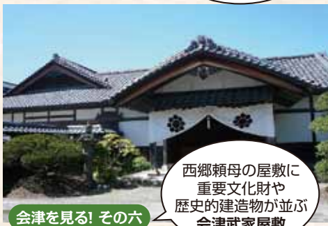
会津を見る! その六