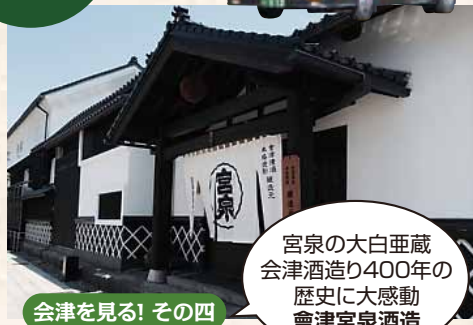
会津を見る! その四